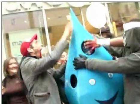
Les Zombies et l'eau, même pure, n'ont jamais fait bon ménage... [Respect à la goutte!]

Les adeptes et loyaux serviteurs du Z. n'ont rencontré aucune hostilité de la part des vivants. Ces derniers ont reçu en remerciement un florilège d'anciens numéros du Z et le 69 encore tout chaud sorti des presses. Wouï, c'est pas permis d'être un mort-vivant le samedi après-midi dans les rues de la ville. Mais les zombies