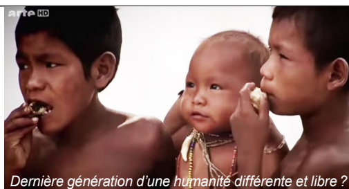
Dernière génération d'une humanité différente et libre ?

Un missionnaire, Daniel Everett, est parti il y a plus de 35 ans soumettre au christianisme une tribu d'Amazonie (Brésil) encore éparignée par la religion judéo-chrétine.