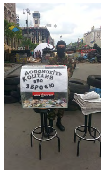
"Aidez-nous avec de l'argent ou des armes" c'est possible ?