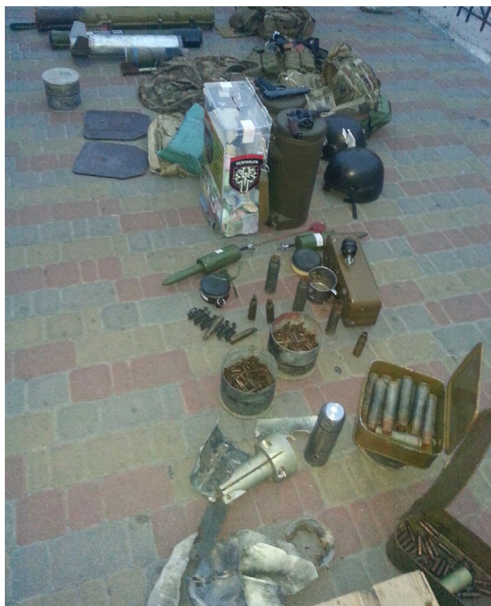
Pravy Sektor expose une petite partie de son butin en armes et essaie de recruter de nouveaux adhérents.

et la création de brigades militaires d'extrême droite comme la brigade AZOV allaient se retourner contre ses initiateurs.