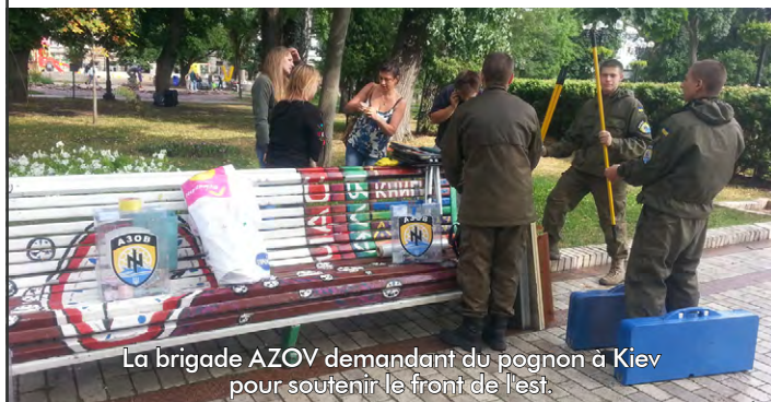
La brigade AZOV demandant du pognon à Kiev pour soutenir le front de l'est.