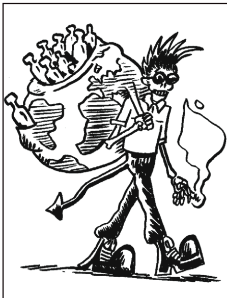
LE BOURLINGUEUR / EDITIONS GACHETTE 133,5 pages – 2015 / Traduit en 12 langues (même en suisse-allemand)