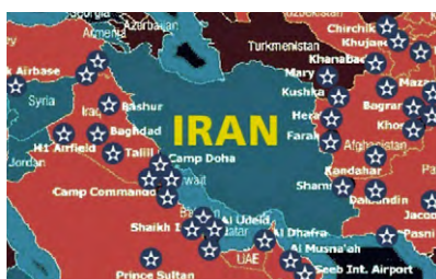
★ Bases US/OTAN autour de l'Iran, le rapprochement ne va pas être trop compliqué.

Aussi captivant que le tour du monde du joujou Richar Impulse, qu'une Crise grecque, ou qu'un beau massacre djihadiste, le réchauffement thermostat 1,3 entre l'Iran et les nations occidentales ou occidentalisées – dont se trouve en première ligne les USA – ça fait vraiment chaud au cœur. Surtout chaud aux comptes en banque des multinationales.