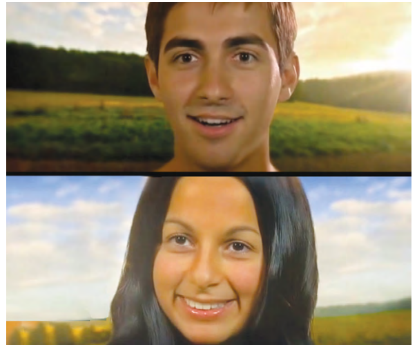
Adam & Eve, quel beau casting de la super-prod. Eden Corp.

J'essayais de me concentrer et d'avaler ce flux ininterrompu d'informations sans queue ni tête sans broncher, mais le contenu de mes intestins donnait maintenant l'impression de danser le pogo dans mon ventre. La conférence s'est terminée dans des applaudissements émus.