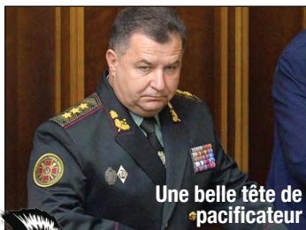
Une belle tête de pacificateur

Mi-octobre 2014, tout va mieux dans le meilleur des mondes, avec un retrait des troupes russes qui traînaient à la frontière... ou en Ukraine, c'est selon, pour des exercices militaires depuis 4 mois.